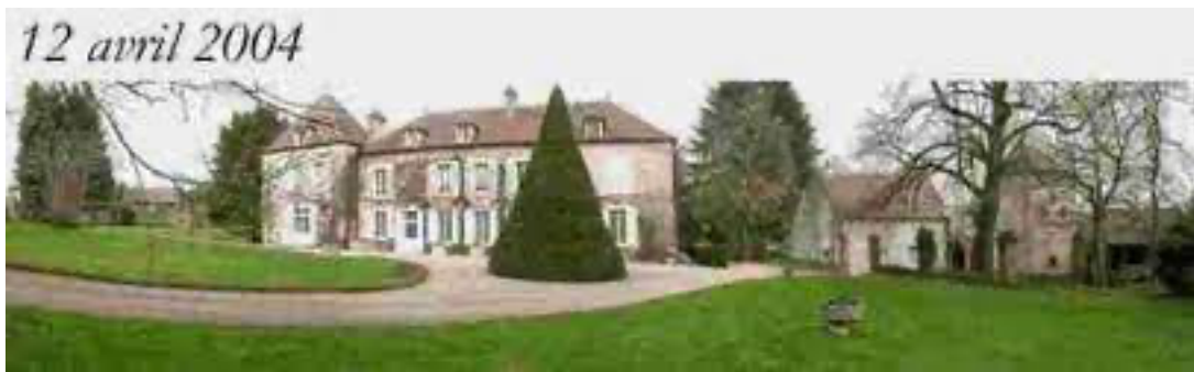
Château de Montillot (proche le Bois du Fay)

Eyr, sgr du Fay (le Bois du Fay, à Montillot, 1648)