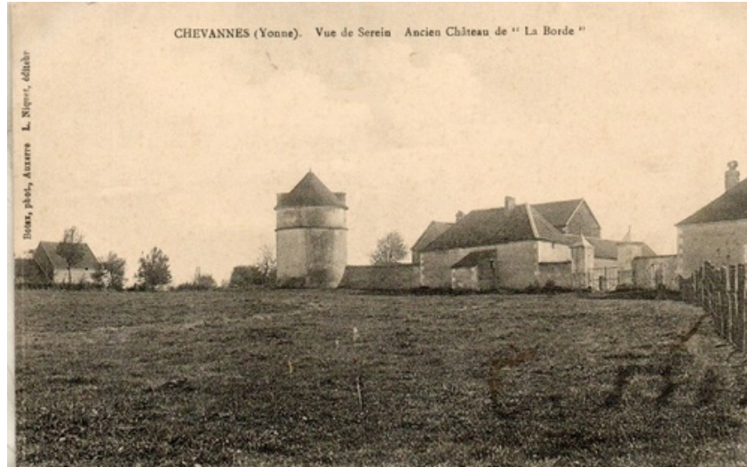
Château de la Borde à Serein (Chevannes, 89)