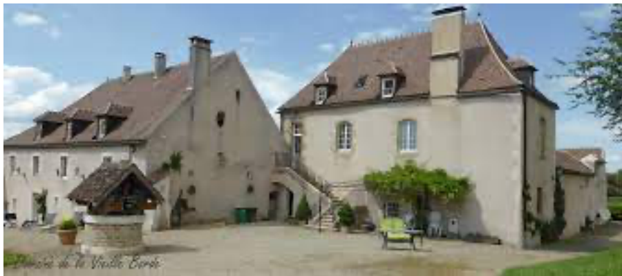
La Vieille Borde (Asquins)