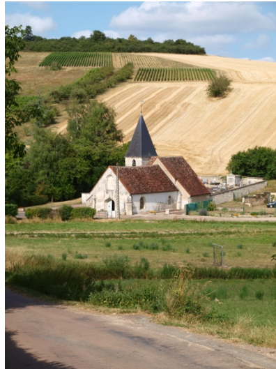
Eglise de Mouffy