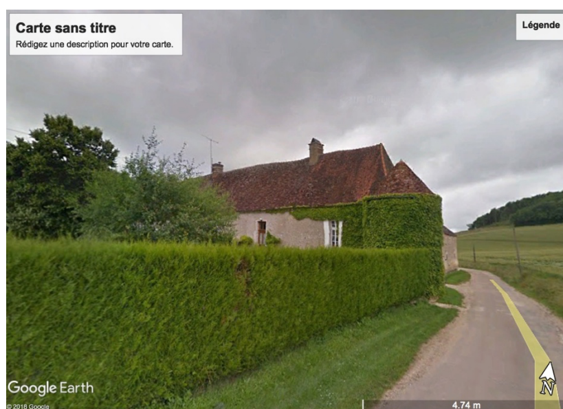
Manoir de Pesteau à Merry-sec