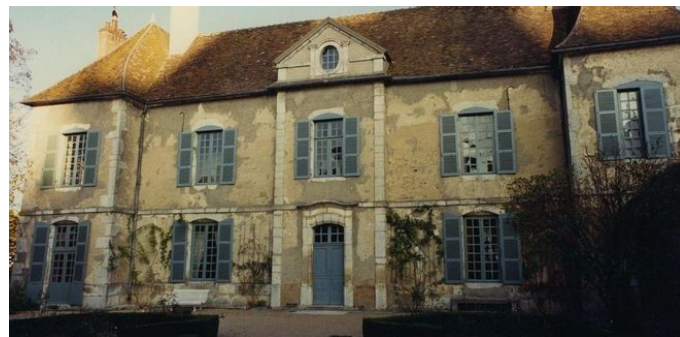
Maison de Vaulabelle à Chatel-Censoir