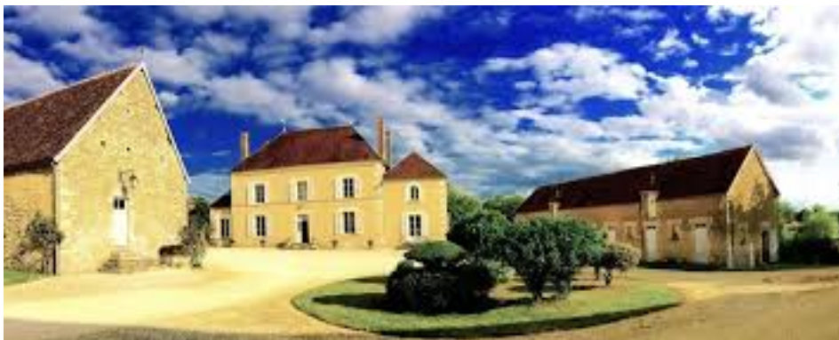
La Roussille (Entrains-sur-Nohain)

Sgr de la Roussille 1 ; Marchand de bois, greffier du Grenier à sel de Clamecy, acquéreur de biens de la famille de Blanchefort