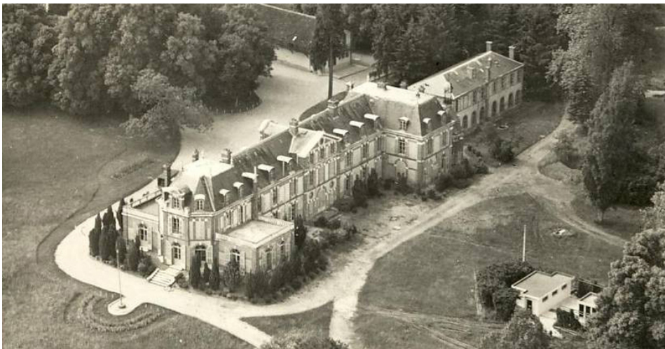
- La Bruslerie (Douchy) (prop. d'Alain Delon)