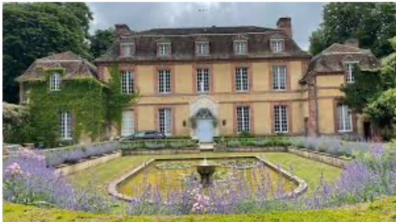
Le Grand Courtoiseau (Triguères)

Le manoir actuel, aux proportions harmonieuses, a été érigé au 18 ème siècle à la place d'une forteresse rectangulaire établie vers 1480 par la famille d'Avy . Il est typique de l'évolution des demeures aux champs fréquentes dans le Val de Loire depuis la fin du Moyen Age. L'absence des bâtiments agricoles et d'une basse-cour indique que le manoir a perdu sa fonction économique au profit de celle résidentielle. On note également l'absence de la fonction défensive. Probablement entouré de douves à l'origine, le manoir s'est constitué autour d'une cour centrale rectangulaire ornée d'un large bassin et selon un plan en U tout à fait typique de l'architecture solognote...Sa transformation, voire sa reconstruction, est attribuée à la famille Dupré de Saint-Maur, propriétaire au cours du 18 e siècle.