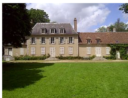
Ch. du Pin, Mérinville (45, près Ferrières)