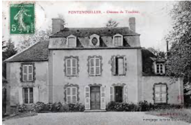
Château de Truchien, à Fontenouilles-Charny (89)