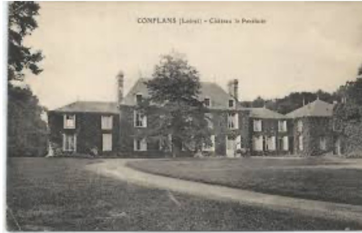
Château du Perthuis (Conflans)

Ce château offre le spectacle d'une belle maison de style parfaitement classique, entourée d'une grande cour d'entrée, verdoyante et arborée, à laquelle on accède par une belle grille en fer forgé. L'architecture, du XVIIIe siècle, est simple : un pavillon central à un étage surmonté d'une haute toiture. Un petit fronton agrémenté la porte d'entrée. De chaque côté, deux prolongements moins hauts, sans doute ajoutés postérieurement. Cet aspect ne correspond pas à son allure primitive extrêmement ancienne . La partie centrale fut sans doute construite en 1706 par un David, dont la famille possédait cette terre depuis le Moyen Âge . Son successeur vendit en 1768 la propriété à un Parceval qui l'agrandit considérablement en 1771. Mais, en 1787, le château fut vendu au baron Henri de Triqueti, consul de Sardaigne. L'un de ses descendants le plus original fut le sculpteur Henri de Triqueti (1804-1874), artiste montargois trop peu connu, auteur d'une production variée et abondante ayant pour sujet l'histoire, la littérature et la religion.