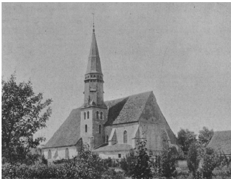
Triguères, église St-Martin