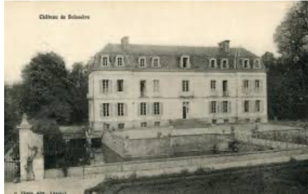
Escolives (89), église Ste-Camille et château actuel de Bellombre