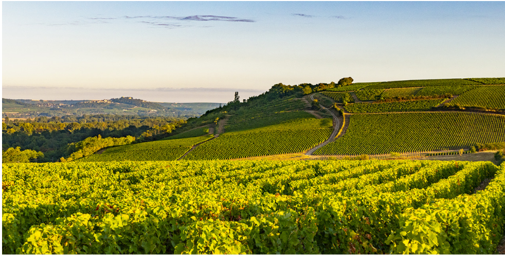
Vignes à Pouilly