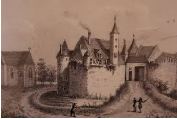
Ancien château de Vergers vers 1840 (in Album Le Nivernois)