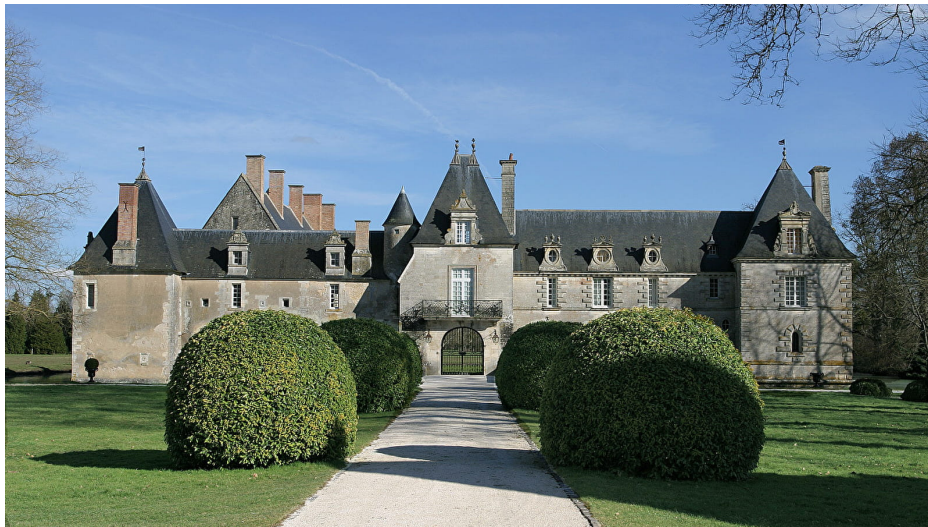
Château des Granges (Sully-la-Tour)