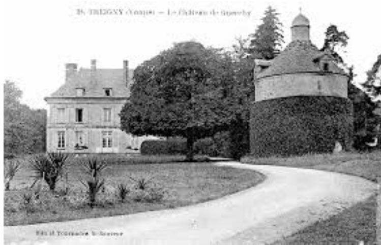
Château de Guerchy (Treigny, 89)