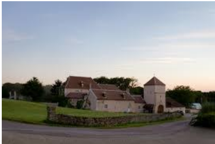
La Vieille Borde (Asquins, 89)

X N. de LA BORDE ( ? – la Vieille Borde à Asquins, tout proche de Champcorneille)