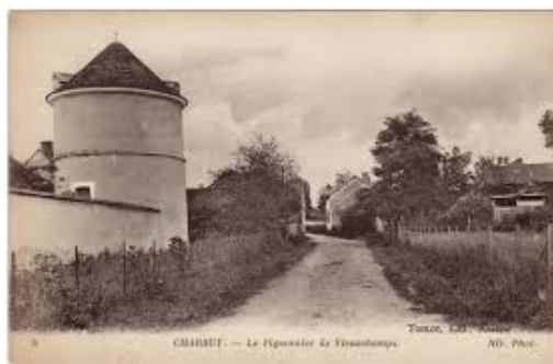
Château de Vieuxchamps (Charbuy, 89)

(X1, le 28 nov 1508, à Châteaurenard (45) à Claude de Lenfernat, sgr de Marnay (Poilly-sur-Serein, d'où Louis, sgr de Marnay)