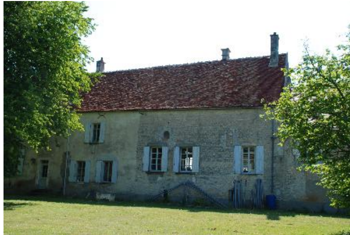
Mairie-école de Druyes (ex-manoir de la Cour-Grenouille)