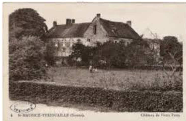
Château du Vieux-Poux (ex-prieuré)

Maison fondée en 1173, au diocèse de Sens, par Dreux de Mello, sgr de Loches et de St-Maurice, depuis Connétable de France. Monastère fort petit et pauvre, occupé par sept « solitaires » en 1717 (Dom Martène).