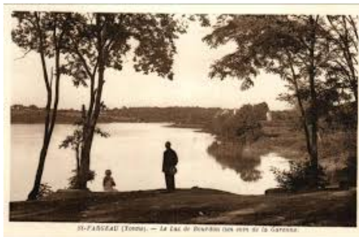
Le site de la Garenne-Noir-Epinoy