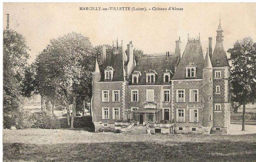
Château d'Alosse (45, Marcilly-en-Villette)