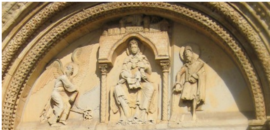
Tympan de Donzy-le-Pré – Sceau de Mahaut de Courtenay