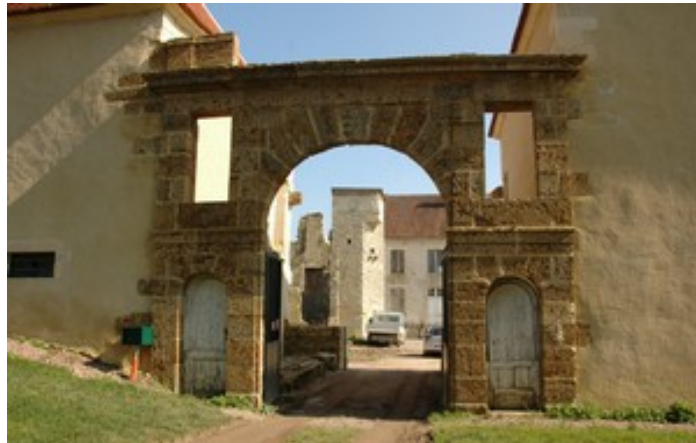
Château de Challement (près Brinon)