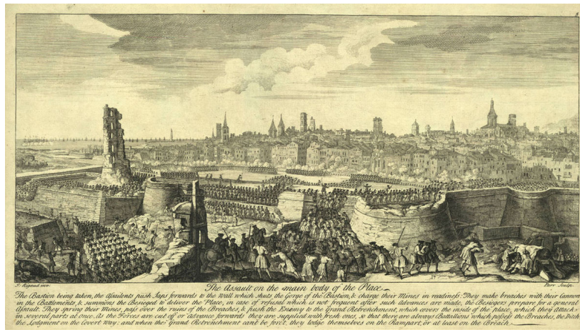
Siège de Barcelone (Guerre de Succession d'Espagne, 1713)

Eyr, Sgr de Magny en Pie, de la Rippe et du Pavillon, Capitaine de Dragons au régt de Lalande, décédé de ses blessures au siège de Barcelone (1713)