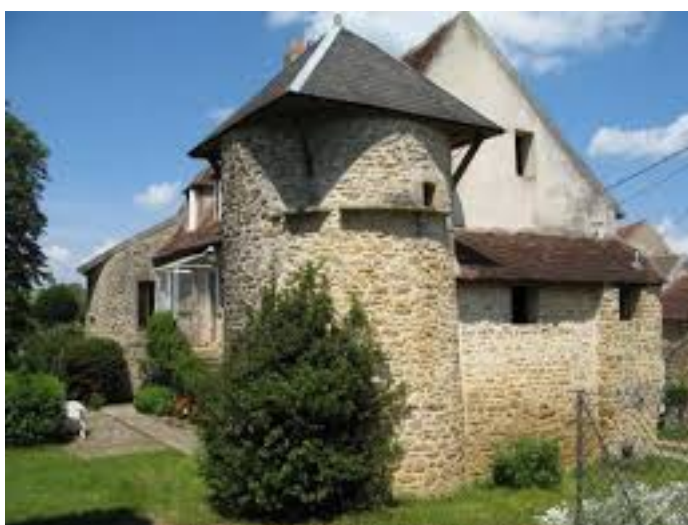
Domaine (ex-château) de Pouilly (Fontenay-près-Vézelay)