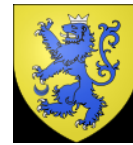
La Grange (Cossaye, 58)