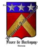
Château de Dardagny (Suisse)