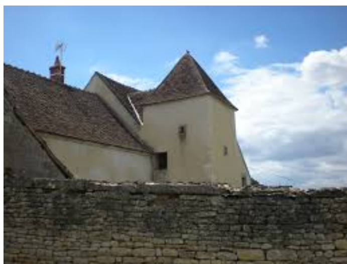
Ancien manoir de Presle (Suilly-la-Tour, 58)