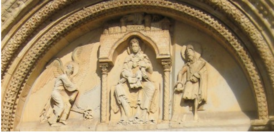
Tympan de Donzy-le-Pré – Sceau de Mahaut de Courtenay