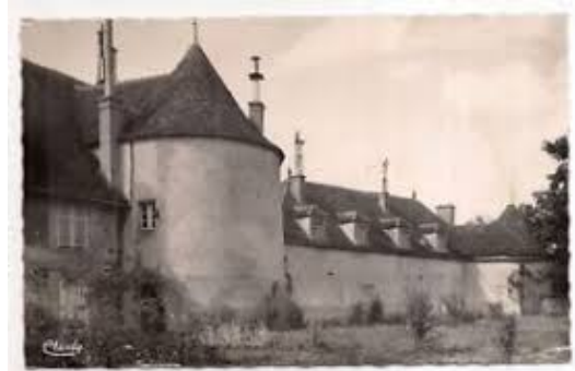
Château de Presles, fief acquis en 1440 (Cussy-les-Forges, 89)