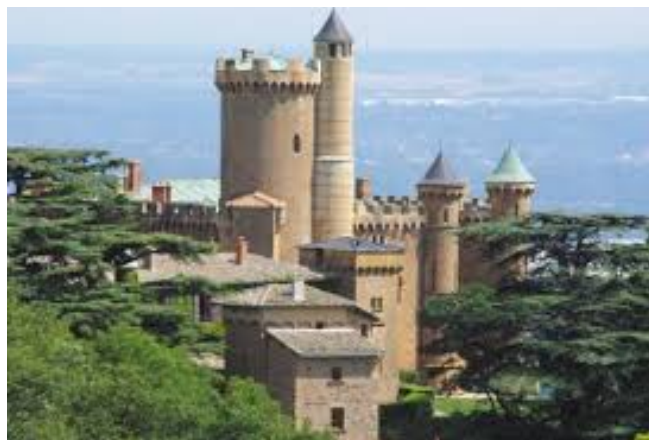
Château de Montmelas (Beaujolais, 69)