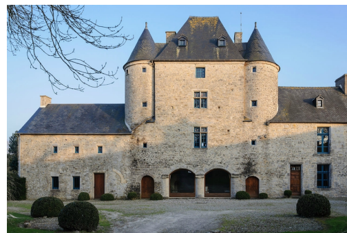
Châteaux de Pisy (Yonne) et de Sainte-Marie-du-Mont (Manche, v. 1600)