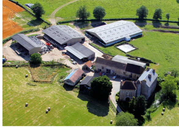
Château de Champlevois (près Cercy-la-Tour)

Le pavillon de la porte, avec les traces du pont-levis et de la herse, date des 13 et 14 e siècles. Un écusson y fut rajouté au 15 e siècle et porte : au 1 « Sautoir Engrelé » qui est de Ferrières, au 2 « un lion », au 3 « un bandé avec une bordure et d'une croix ancrée », et au 4 « semé de France ». Les quartiers 2 et 4 sont de Vendôme (cf. infra, branche cadette). La tour hexagonale relie cette partie à une autre, moins ancienne, et qui doit remonter aux 15 e et 16 e siècles.