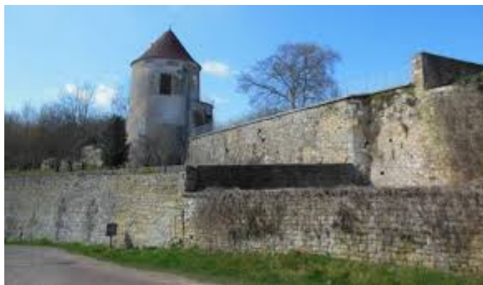
Ancien château de Chatel-Censoir (89)

Sgr de Ferrières, Chatel-Censoir 4 , Island et Presle ; sgr de Genay (21) ; Villechaume, Villeprenoy en pie – voir cette notice -, et des moulins de Druyes 5