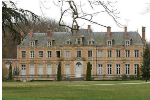
Château actuel de Mézières-les-Cléry 16