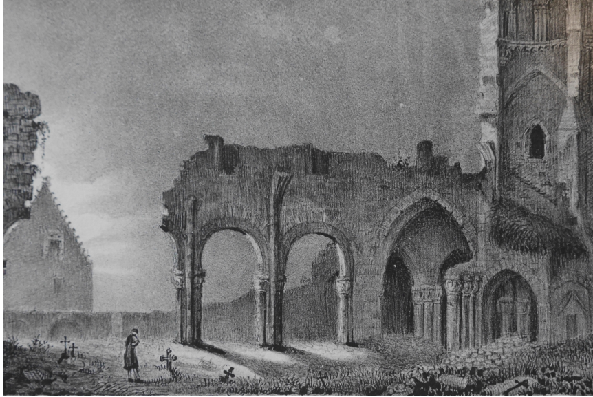
Donzy-le-Pré (v. 1830)