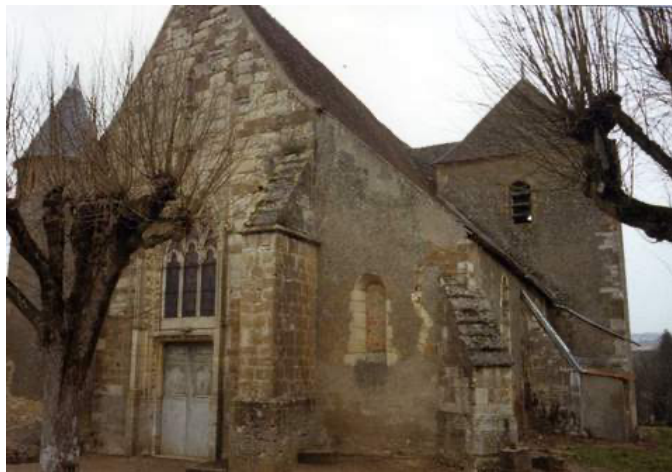
Eglise Saint Agnan de Colméry