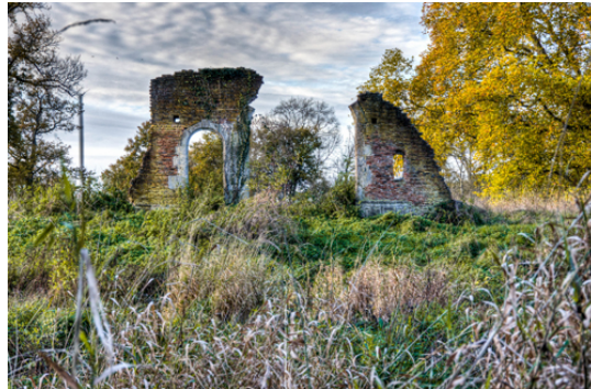
Ruines de Chateaufieux ( La Ferté-Beauharnais ou Aurain, 41, Beuvron )