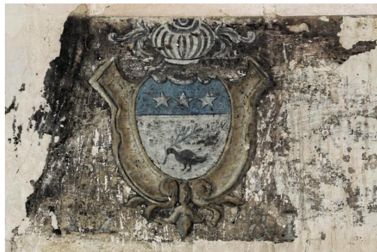
Bas-relief dans l'église de Saint-Père

Acquiert pour la somme de 29.500 livres le château et le domaine de Saint Père le 9 juin 1712.