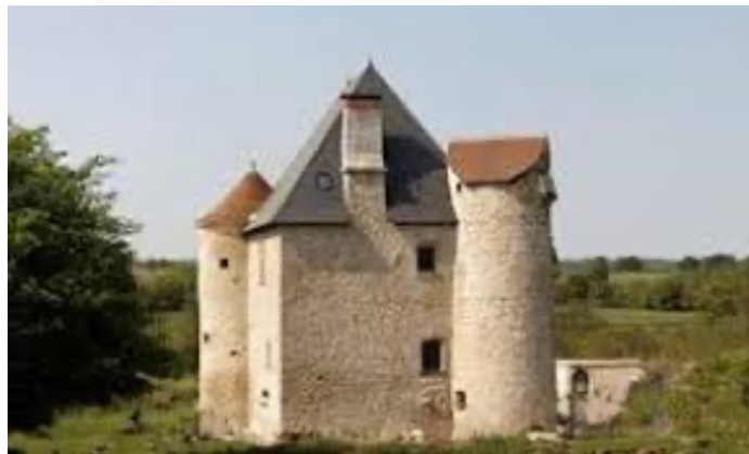
Château de Thaveneau (Mouron-sur-Yonne)