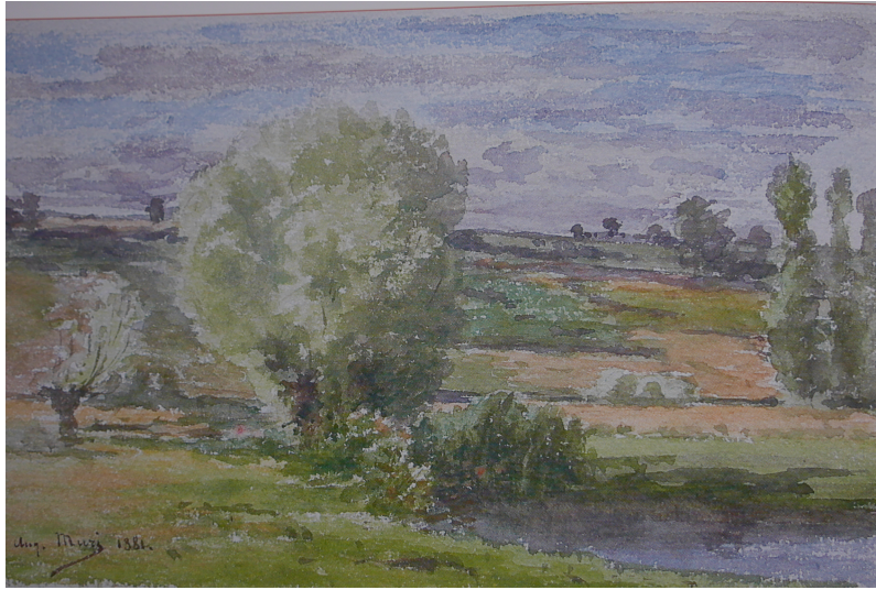
La vallée du Nohain par Auguste Muri (aquarelle, 1881)