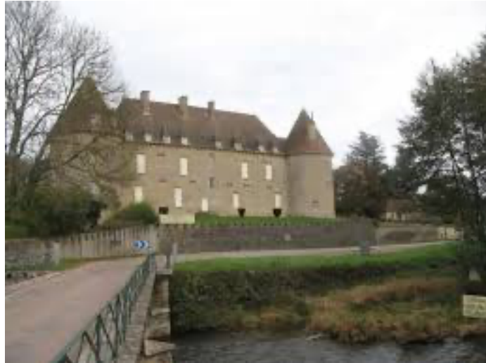
Château de Marcilly (Cervon)