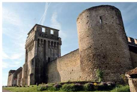
Château comtal de Druyes

Eyr, sgr de la Motte-Panardin, Le Colombier en pie., Aubigny....Capitaine et Gouverneur de Druyes.