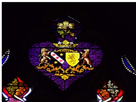
Vitrail de l'église St-Pierre-aux-liens d'Etai-la-Sauvin

En Nivernais : « d'azur à la bande d'argent chargée de trois coquilles de gueules, et à deux étoiles aussi d'argent »