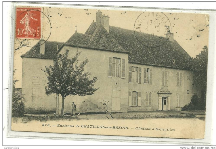
Le château d'Espeilles (à Montapas)